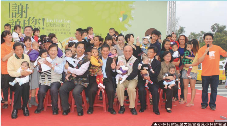
▲小林村新生兒大集合看見小林新希望

高雄市杉林區日光小林社區已於100年12月24日落成，隨著居民陸續入住，在全體住民的努力下，逐漸將社區打造成記憶中的小林村。社區居民選擇在101年2月25日舉行辦桌感恩餐會，感謝一路關心協助小林村重建的伙伴。副總統當選人吳敦義、行政院重建會執行長陳振川、楊秋興政務委員、陳士魁副秘書長、立法委員黃昭順、高雄市李永得副市長、中華民國紅十字會總會秘書長吳斯懷等人出席參加，分享小林人的喜悅。