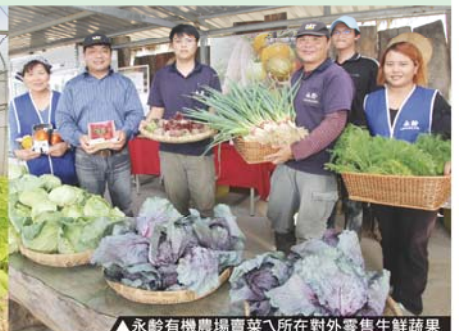
▲永齡有機農場賣菜所在對外零售新鮮蔬果