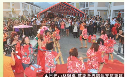
▲日光小林辦桌 感謝各界陪伴支持重建

餐會於歡欣喜悅的氣氛中圓滿結束，並有部分來賓選擇在社區中home stay，親身體驗小林人的好客熱情及社區獨特的平埔文化氛圍。