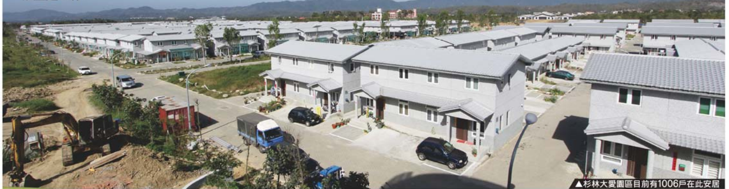
▲杉林大愛園區目前有1006戶在此安居

杉林大愛永久屋可說是政府、民間合力投入重建的典範，政府投入13億多元購置土地、建置公共設施，協助縮短行政流程，援建的慈濟基金會動員龐大的物力、財力及人力，在短短的88天就完成600多戶永久屋，是全國第一個落成啟用的永久屋基地，居民在99年農曆年前就歡喜進住。因有居住的需求，慈濟基金會再次援建二期，共計1,006戶，在這過程中，政府投入8億多元取得土地，5億多元投入公共設施，並持續協助解決災區家園重建、社區整體營造、就業、就學等問題，希望能達到符合鄉親們的期許，早日完成重建工作。