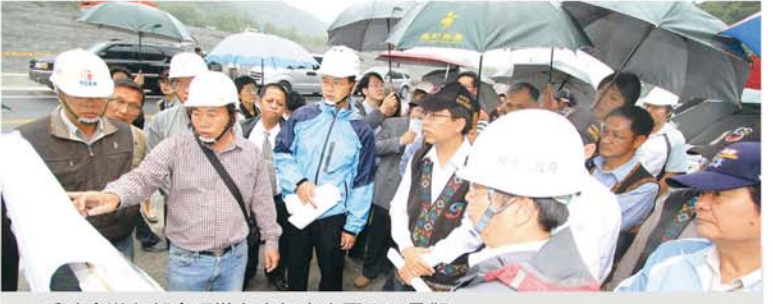
▲重建會邀各部會現勘台東知本商圈入口景觀。

充分溝通說明重建業務辦理期程，重建會也將加強管控各項重建預訂執行進度，使台東知本商圈藉著這次產業重建示範點的推動，產業能夠脫胎換骨，並與環境、生態及文化相結合，永續經營。 陳副執行長在會中特別強調，任何重建工作都要設定明確目標，大家朝此目標加速推動各項工作，重建會將彙整各單位目前分別積極推動中的工作，訂定一個明確管控表加以列管，讓重建成果在一定時間內展現成果。