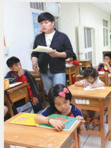
▲生活重建中心提供課輔服務。

內政部依據「莫拉克颱風災後重建特別條例」編列4億9,110萬元，在各災區設立生活重建服務中心，提供生活、心理、就學、就業及各項福利服務。目前全國有26處重建服務中心深入各受災據點提供服務，協助受災民眾重建家園。