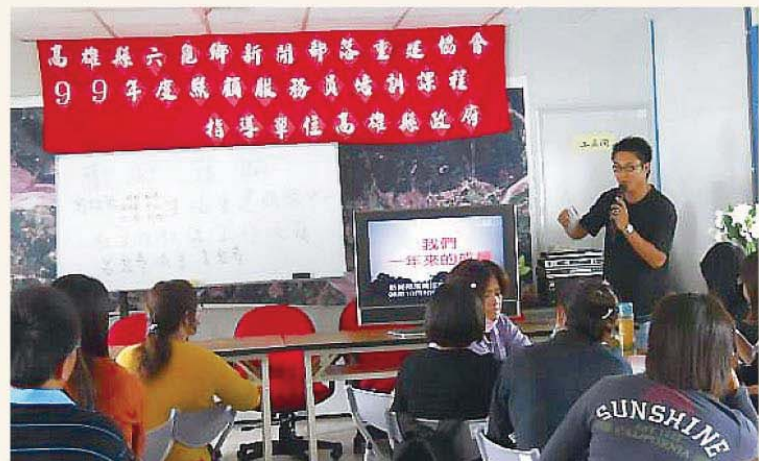
▲99年照顧服務員培訓課程開課了。

性、便利性、預防性等多元服務，形成一個資源與資訊工作平台，讓個人、家庭、社區組織及團體，藉由培力機制回歸互助與自主化運作，重建工作夥伴就是抱持這種感恩心情服務民眾，「愛」讓我們與民眾零距離。(文/高雄縣政府社會處甲仙/六龜生活重建中心督導)