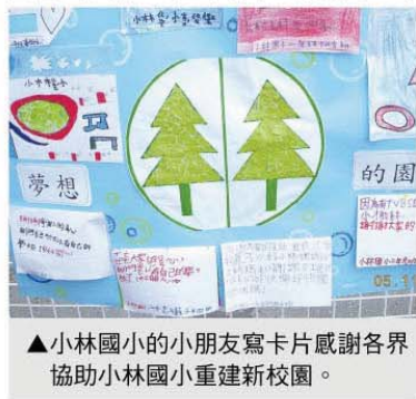
▲小林國小的小朋友寫卡片感謝各界協助小林國小重建新校園。

小林國小動土典禮在學生民俗表演活動中熱鬧展開，場面溫馨感人，小林居民們滿心感謝，希望不久後將擁有與大自然融合的美麗校園，提供小林學童優質的學習空間及教育環境，讓歷經去年莫拉克風災的孩童走出傷痛、迎向未來。