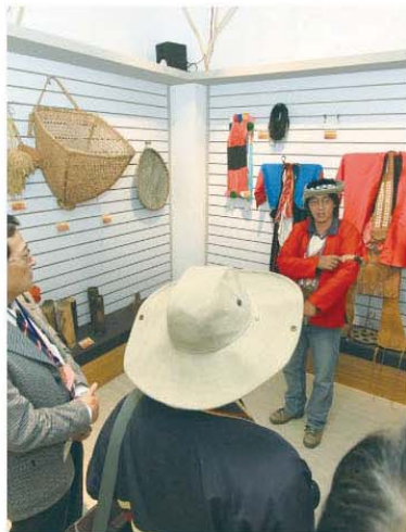
▲國內媒體記者拜訪阿里山鄉樂野村的「優遊吧斯」阿里山鄒族文化部落。

行政院新聞局為讓國內媒體能更深入瞭解重建進度及成果，11月6日由田永康處長帶領國內雜誌社、「小地方—台灣社區新聞網」地方觀察員等20人，前往阿里山部落進行深度參訪，拜訪阿里山鄉樂野村的「優遊吧斯」阿里山鄒族文化部落、嘉義縣番路鄉的永久屋基地日安社區，對於災民選擇在永久屋展開新生活，或由都市回到故鄉努力奮發，都留下深刻印象。