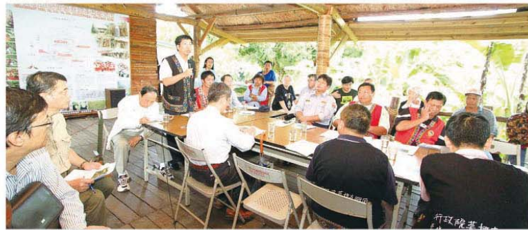
▲茶山橋現勘後立即開會研討。

會上決議為求嘉129線鄉道的完整性及永久性，請嘉義縣政府參酌專家學者意見再檢討修正，並壓縮行政程序，加速茶山橋重建，以利茶山村觀光產業復甦。