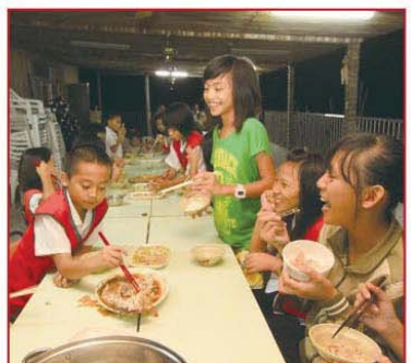
▲山美部落安親課輔班同學們一起開心用晚餐。