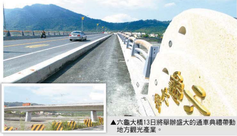
▲六龜大橋13日將舉辦盛大的通車典禮帶動地方觀光產業。

當天在六龜大橋橋面上，將有當地的宮廟、社區發展協會、學校團體分別組成的太鼓陣、舞獅、天女灑淨散花、十二金釵、鑼鼓陣、開路鼓、五穀先祖、觀世音菩薩、玄天上帝大轎等熱鬧逗陣，還有來自全省各地的200輛SUV房車，一同