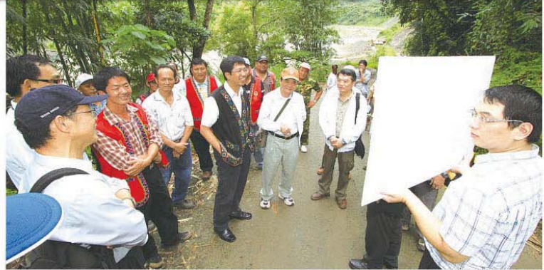
▲重建會同專家會勘茶山橋重建地點。

產業的復甦更是村民賴以維生的命脈，應使居民有通暢的交通。與會的縣議員、地方代表、村長、部落會議主席等人踴躍發言，都要求重建茶山橋，以求有一座永久性又有特色的橋樑，除可增加觀光產業發展，並可使居民對外交通更有保障。