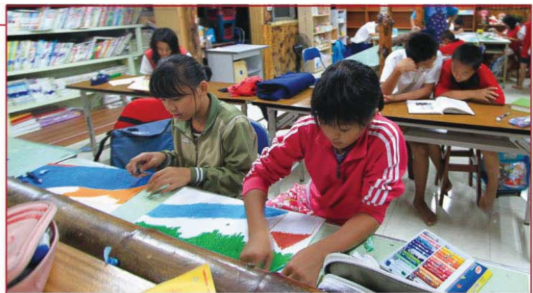
▲山美部落安親課輔班自由活動時間。

最近半年他們還學看故事畫插畫，師生們一起讀伊索寓言故事，再以集體創作方式為每個故事畫一張插圖，現今已完成了120幅，未來要集結成書出版；目前著手繪製