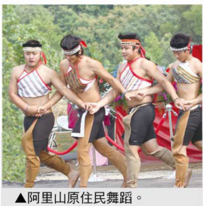
▲阿里山原住民舞蹈。