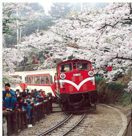
▲穿梭在吉野櫻的阿里山火車。