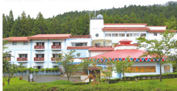
▲阿里山青年活動中心。