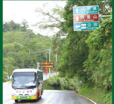
▲阿里山公路將可通行大型遊覽車。