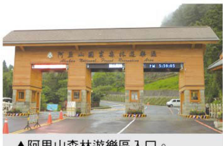
▲阿里山森林遊樂區入口。