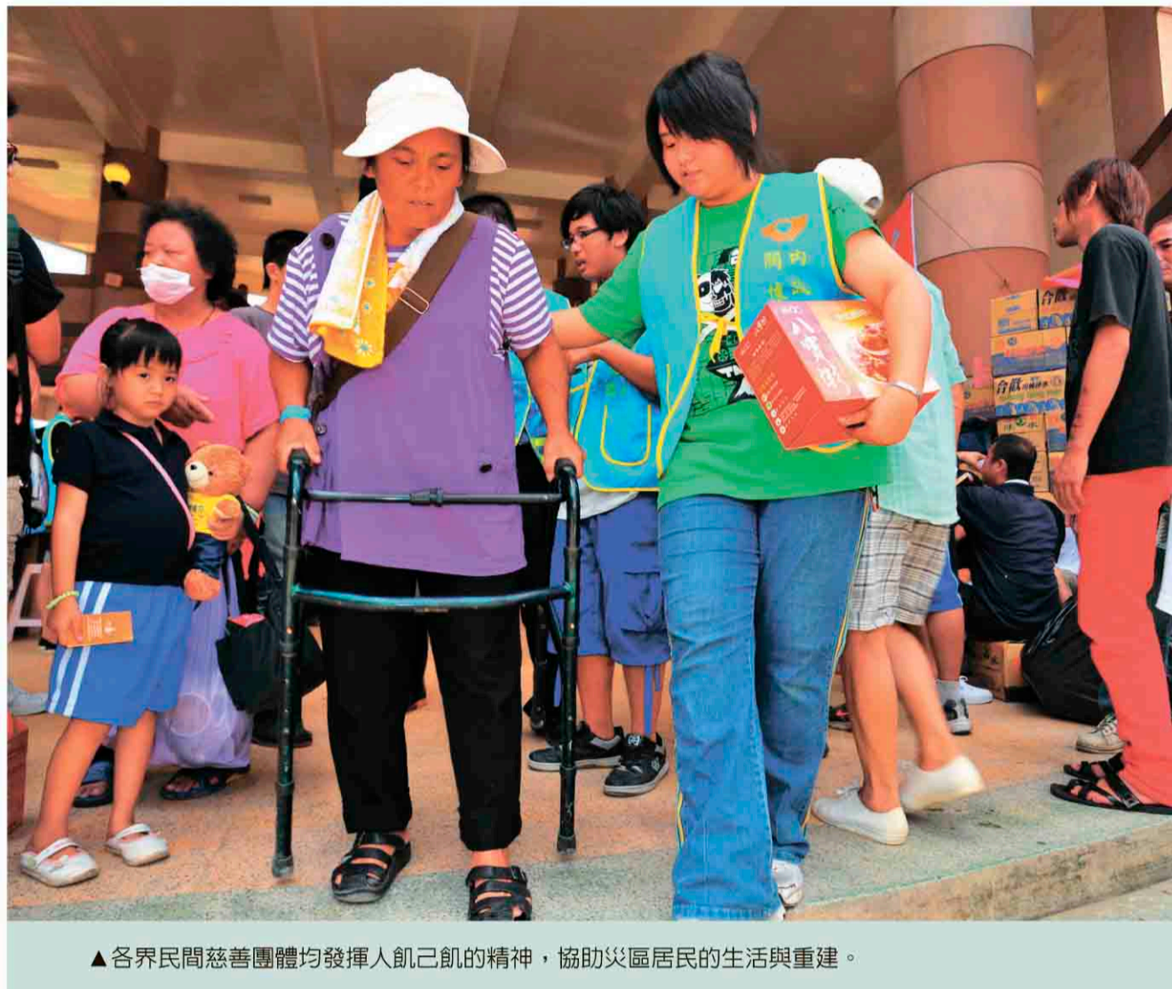
▲各界民間慈善團體均發揮人飢己飢的精神，協助災區居民的生活與重建。

災區仍有部份學生生活尚未受到妥善照料，救災志工在得知後，立刻送上生活包，提供洗髮精、沐浴乳等生活用品。至於學生餐飲、生活費等，評估後給予協助。