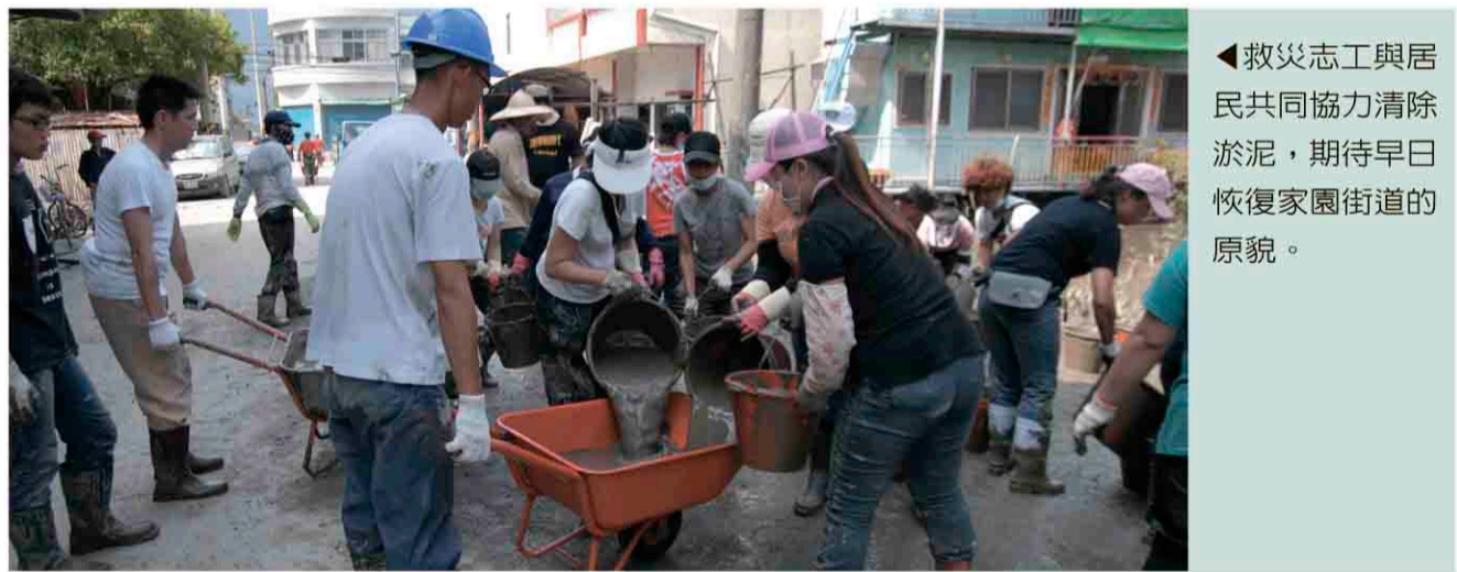
▲救災志工與居民共同協力清除淤泥，期待早日恢復家園街道的原貌。

本項職業訓練探索研習，將俟災民安頓後即可開始受理報名，並視報名形調整辦理職類及班次。洽詢專線：職訓局南區職訓中心(07)821-0171轉302到306。