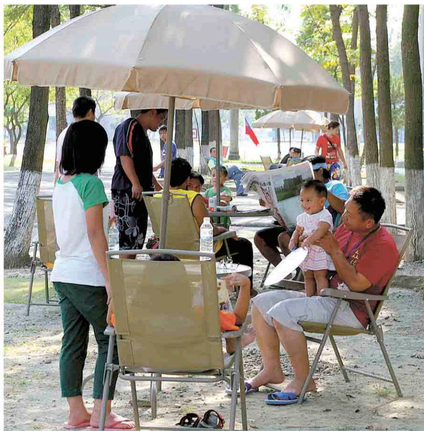
▲桃源鄉災民遷入鳳雄營區,有寬廣的休閒活動空間,有的家庭成員、鄰居聚在樹下看報紙、逗孩子玩,顯得很悠閒。

為使災民可以有比較舒適的生活環境,劉院長責成國防部與退輔會分別在各營區及榮民之家準備完善的床位計7,000個,於8月31日前將全部收容所的災民遷入營區或榮民之家,將目前災民收容所淨空,同時成立聯合服務中心,協助災民辦理各項民政、戶政、地政、住宅相關事務。