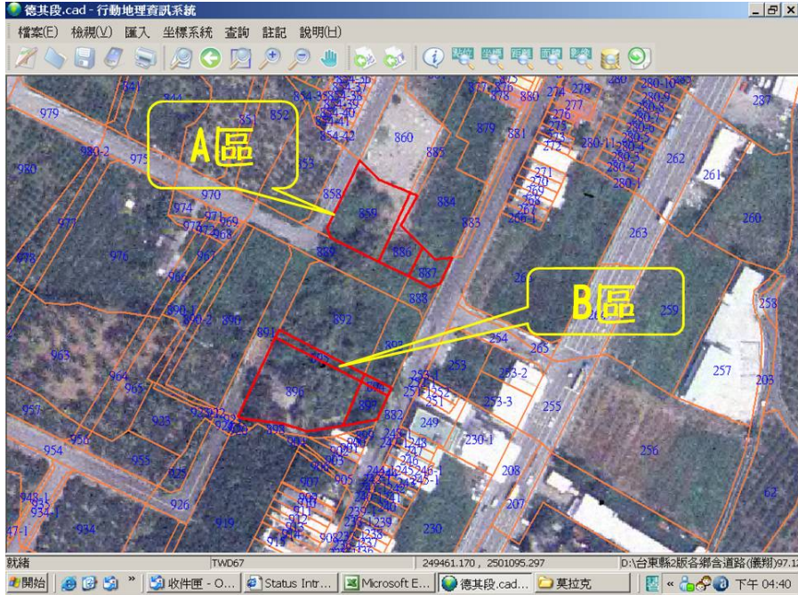
太麻里德其段永久屋基地（A區）都市計畫變更示意圖