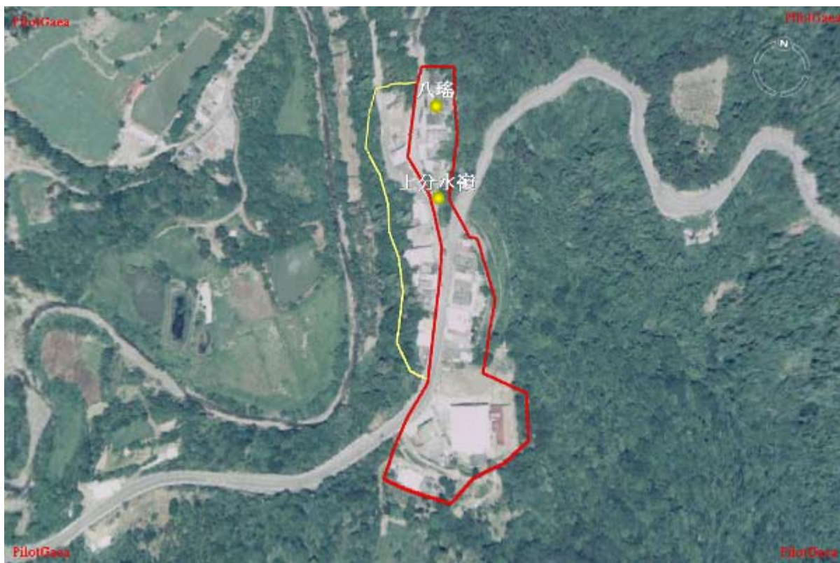
圖 27：長樂村上分水嶺部落災前航照正攝圖