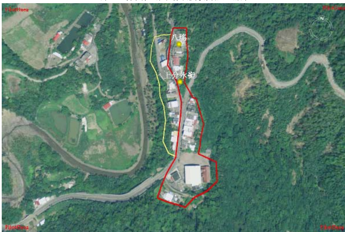
圖 28：長樂村上分水嶺部落災航照正攝圖