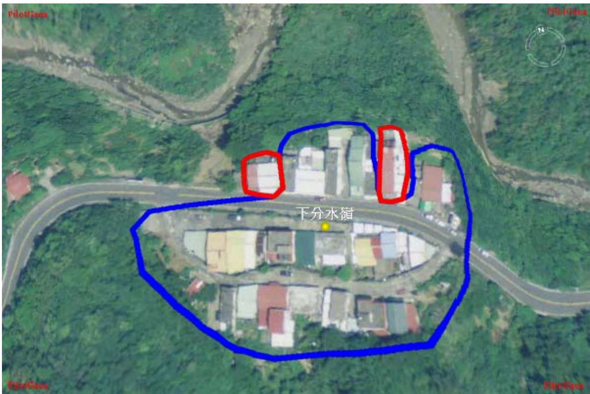
圖 34：長樂村下分水嶺部落災後航照正攝圖