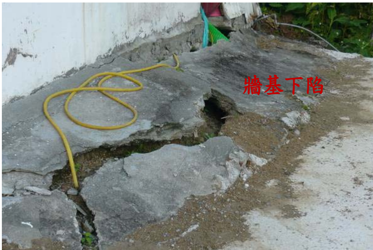
圖 31：長樂村上分水嶺部落台灣基督長老教會等民房三戶東側牆基下陷龜裂