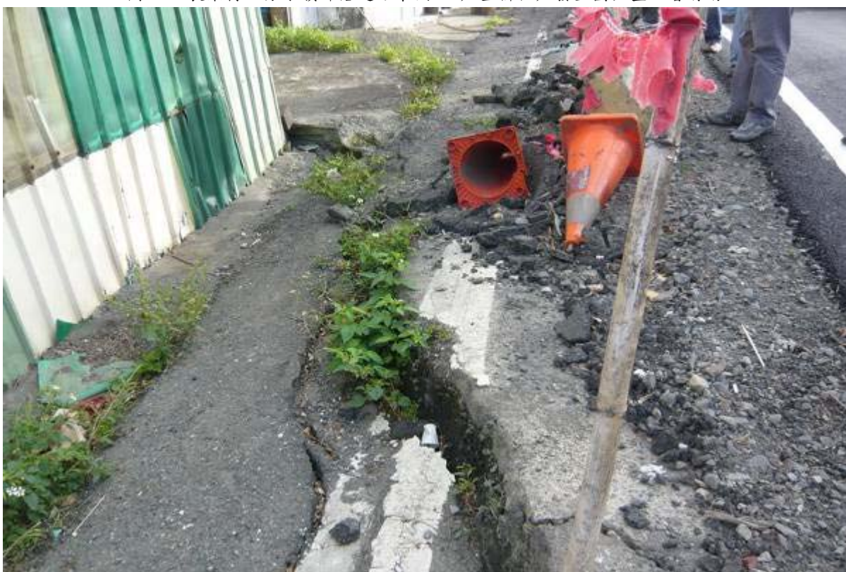
圖 30：長樂村上分水嶺部落道路東側 11 戶整排住戶發生圓弧型地層滑動