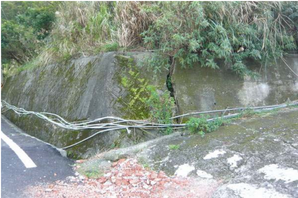
圖 36：長樂村下分水嶺部落聯外道路擋土牆龜裂