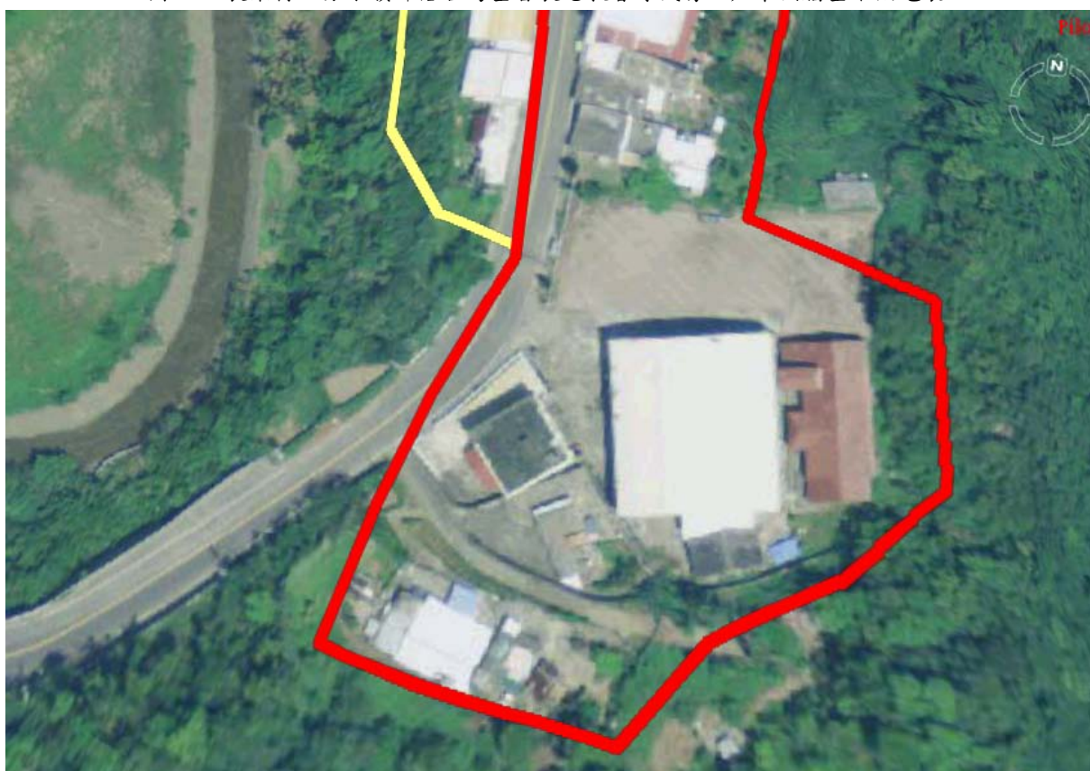
圖 32：上分水嶺部落住屋判定為不安全