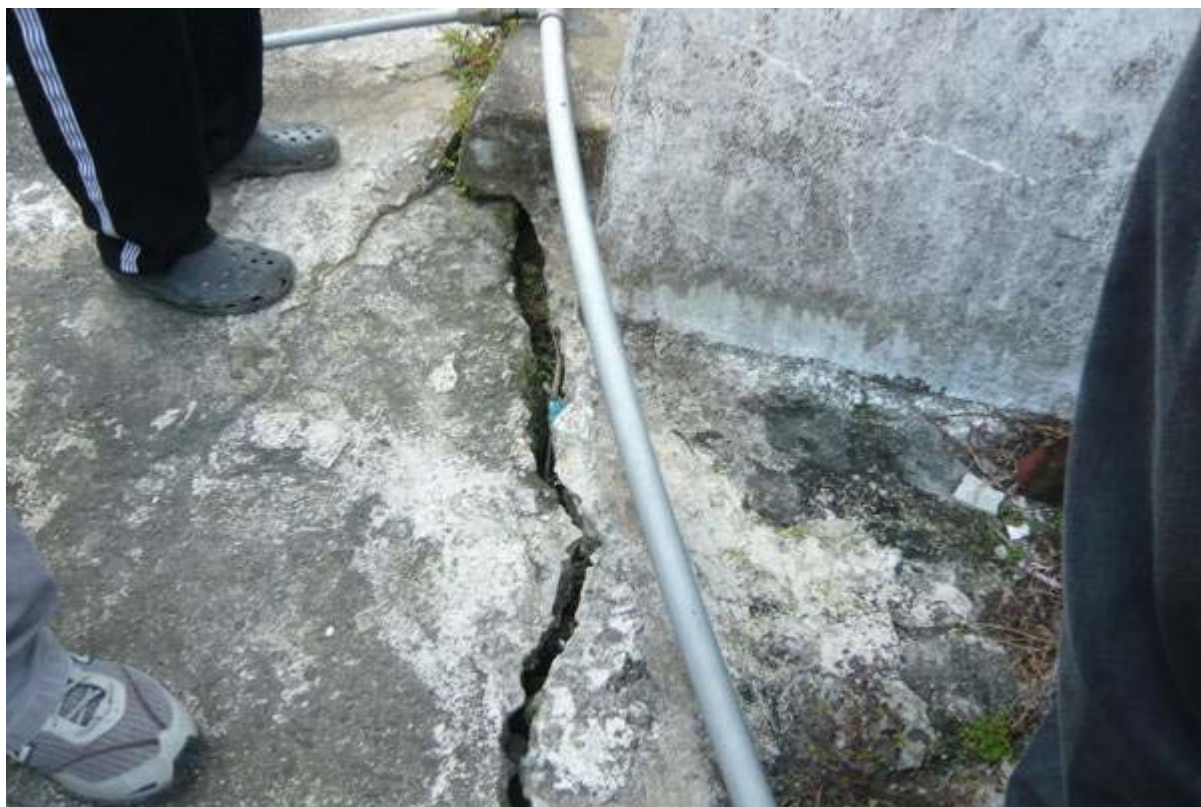
圖 37：長樂村下分水嶺部落道路及房舍龜裂