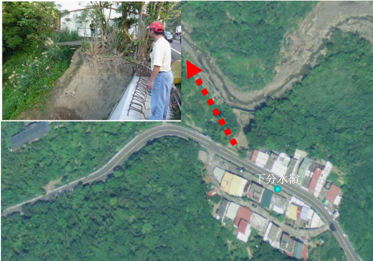
圖 35：長樂村下分水嶺部落道路北側下邊坡河川沖蝕邊坡基腳造成地表沖蝕