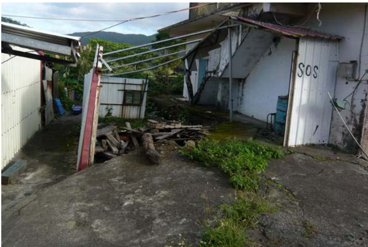
圖 29：長樂村上分水嶺部落道路東側 11 戶整排住戶發生圓弧型地層滑動